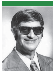
Francisco Cândido Xavier (1910-2002)

Francisco Candido Xavier était un médium brésilien, tout à fait complet quant à ses possibilités de transmission: médiumnité parlante, d'écriture, clairvoyance, xénoglossie, effets physiques...