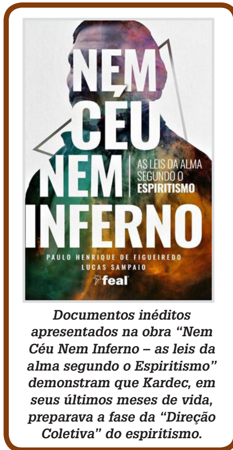
Documentos inéditos apresentados na obra “Nem Céu Nem Inferno – as leis da alma segundo o Espiritismo” demonstram que Kardec, em seus últimos meses de vida, preparava a fase da “Direção Coletiva” do espiritismo.