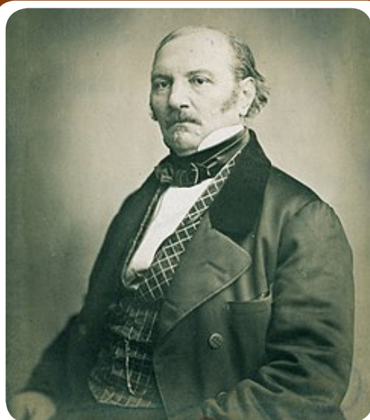
Numa primeira fase – a de elaboração – os procedimentos foram conduzidos pessoalmente por Kardec, na SPEE.

Documentos inéditos obtidos em Paris e apresentados na obra Nem Céu nem Inferno - as leis da alma segundo o Espiritismo 1 demonstram que Kardec, em seus últimos meses de vida, planejou em detalhes essa organização, que inauguraria a "fase de direção coletiva" do Espiritismo. Tratava-se de uma admirável e inovadora estrutura de hierarquia invertida com barreiras às ambições pessoais, sem um poder absoluto concentrado nas mãos de poucos. Haveria um comitê central com atividades compartilhadas