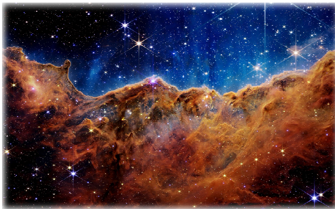
Crédito fotográfico – NASA, ESA, CSA e STScI.

Toda a vez que olhamos por um telescópio, na verdade fazemos uma viagem no tempo, em direção ao passado. Quando apontamos para uma estrela, como por exemplo a estrela Alfa de Centauro , uma estrela dupla, a mais próxima do Sol e consequentemente de nós terrestres, ela está a 4 anos luz de distância e o que vemos é a luz emitida há 4 anos. Ou seja, estamos vendo o passado.