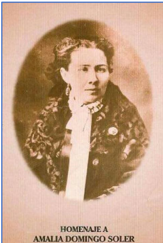
HOMENAJE A AMALIA DOMINGO SOLER

El 29 de abril de 2018 se cumplen 109 años de la desencarnación de la insigne dama del espiritismo Amalia Domingo Soler (1835 – 1909). Entusiasta difusora de los ideales espíritas, poetisa, escritora, amante del razonamiento, el laicismo y la verdad. Su prolífera pluma permitió dejar un legado de conocimientos para generaciones venideras