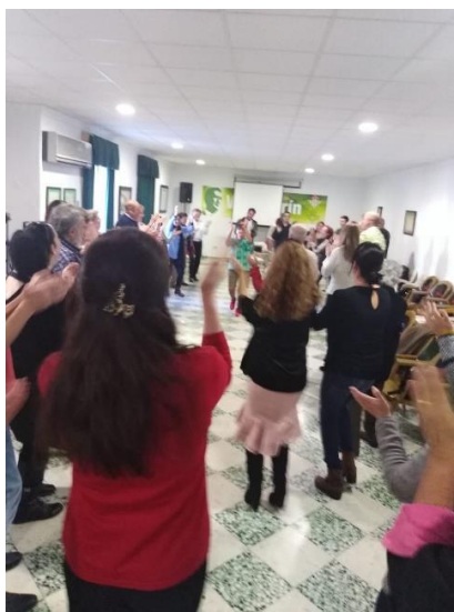
Los asistentes participando del Taller de Risoterapia

Como elemento para controlar estos estados propuso el ejercicio físico, ejercicios de respiración, relajación y meditación.