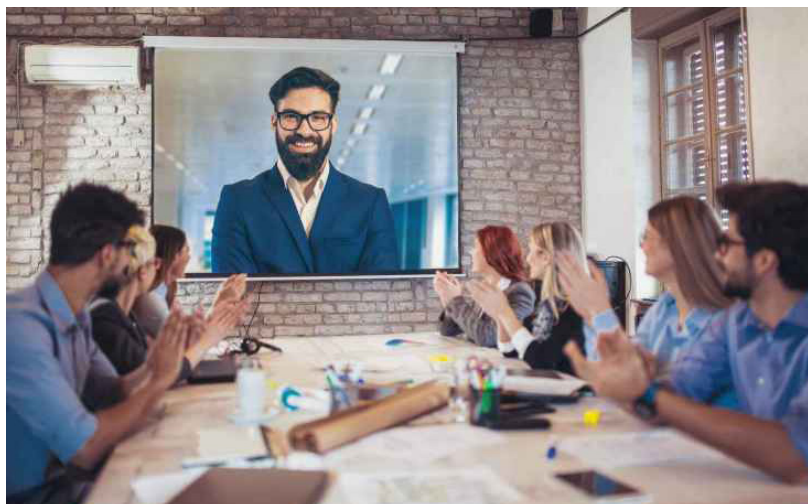
Reuniões virtuais e videoconferências ganham espaço no meio espírita.

Temos recebido notícias sobre teleconferências espíritas que se realizam na Espanha (Centro Barcelonês de Cultura Espírita e outros), em Porto Rico (Escuela Espírita Allan Kardec) e na Argentina (Sociedad Espiritismo Verdadero). Destacamos, aqui, duas experiências exitosas, uma brasileira, outra de âmbito internacional: