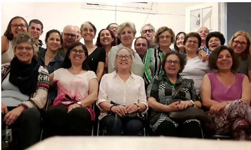
Grupo de uruguaios e brasileiros que participaram do Encontro em novembro