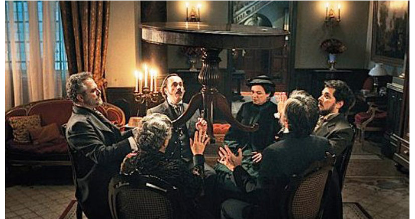
Cena do filme “Kardec” de Wagner de Assis (2018)

“O sistema da multiplicação dos grupos ainda tem como resultado pôr termo às disputas por supremacia e presidência. Cada grupo é, naturalmente, presidido pelo dono da casa ou pelo que for designado, e tudo se passa em família.”. (Revista Espírita – Nov/1861).