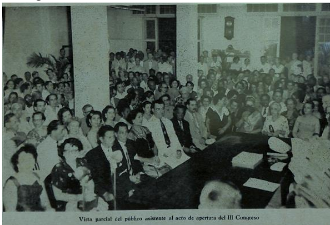
Vista parcial del público asistente al acto de apertura del III Congreso

Assumiram a responsabilidade de organizar este evento, a Confederação Nacional Espírita de Cuba, integrante de CEPA, e a União das Mulheres Espíritas de Cuba, filiada à CEPA, ficando constituída a Comissão Organizadora do III Congresso Espírita Pan-americano da seguinte forma: