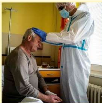
A reportagem da BBC ilustra foto de imposição de mãos como uma das práticas de espiritualidade.

Segundo o cardiologista, os estudos se encaminham para demonstrar a possibilidade de prevenir doenças em geral, "tratando a espiritualidade primeiro", e desenvolvendo no paciente atitudes positivas "como solidariedade, compaixão, humildade, paciência, confiança e otimismo".